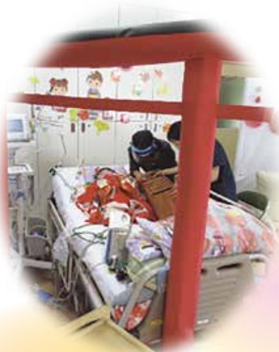
お母様に手伝ってもらって お賽銭です

『これからも患者さん一人ひとりとのかかわりを大切にする看護の提供を目指します。』