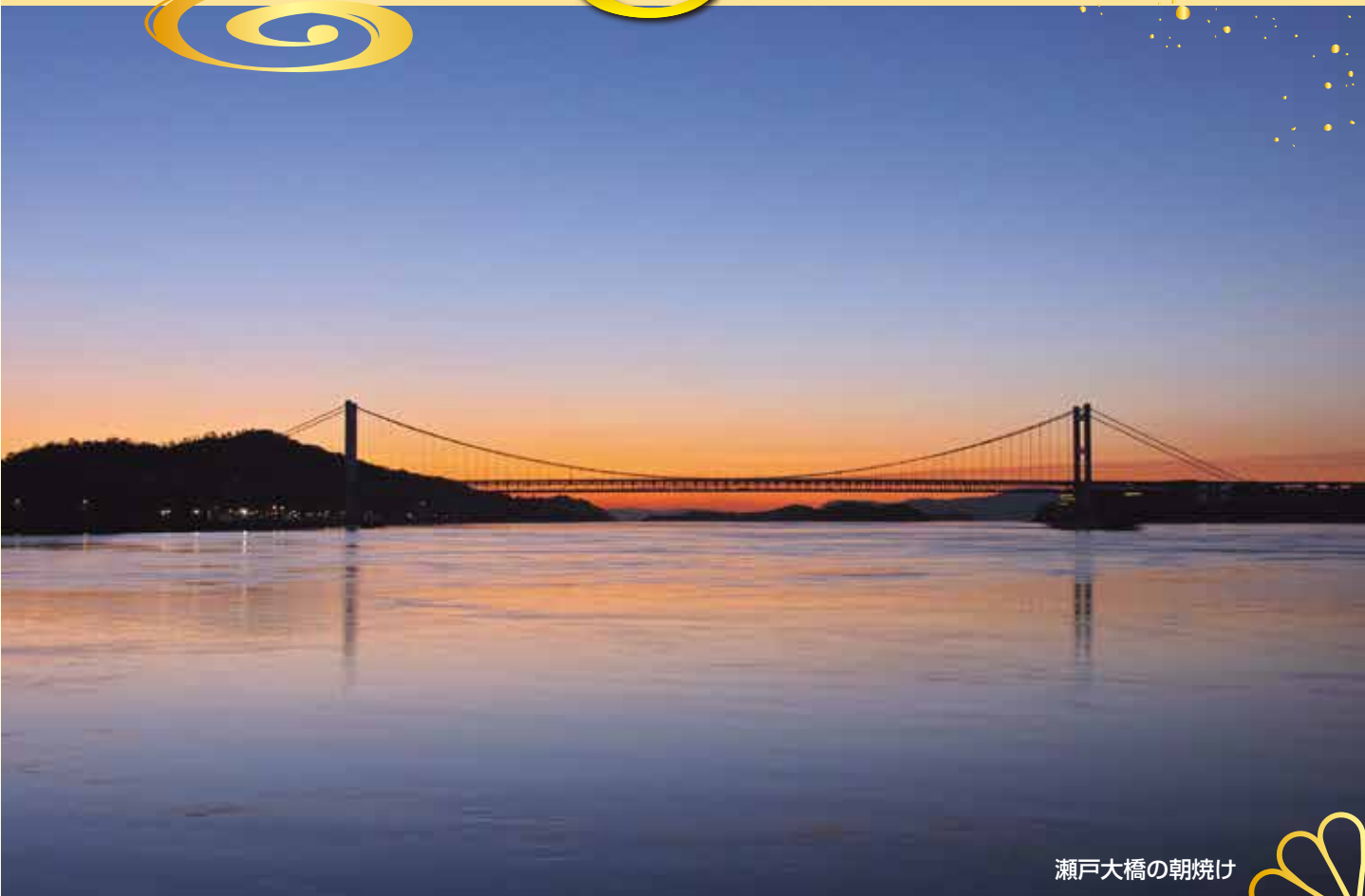
瀬戸大橋の朝焼け