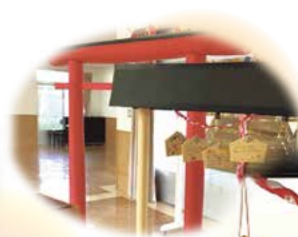
つくし神社へ絵馬を 奉納しました